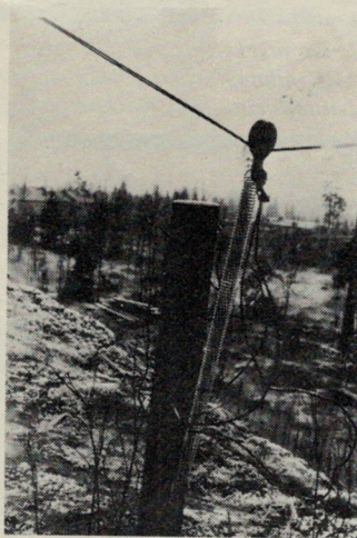
Fig 3. Detaljfoto av fjädrande fästpunkt för delta-loop-antennen.

Förstärkningen på grundfrekvensen över en dipol är ca 2 dB. För varje multipel ökar den ca 1–1,5 dB. Direktiviteten är sådan, att strålningsmaximum fås vinkelrätt mot antennplanet. – Av måtten ovan framgår, att en delta-loop för 3,6 MHz borde vara en intressant amatörantenn. En liten nackdel har dock förfärdigt vid praktiska test och det är att delta-loopen är ganska känslig för elektriskt brus, statiska knäppar o dyl. Den egenskapen torde den dela med alla vertikalpolariserade antenner.