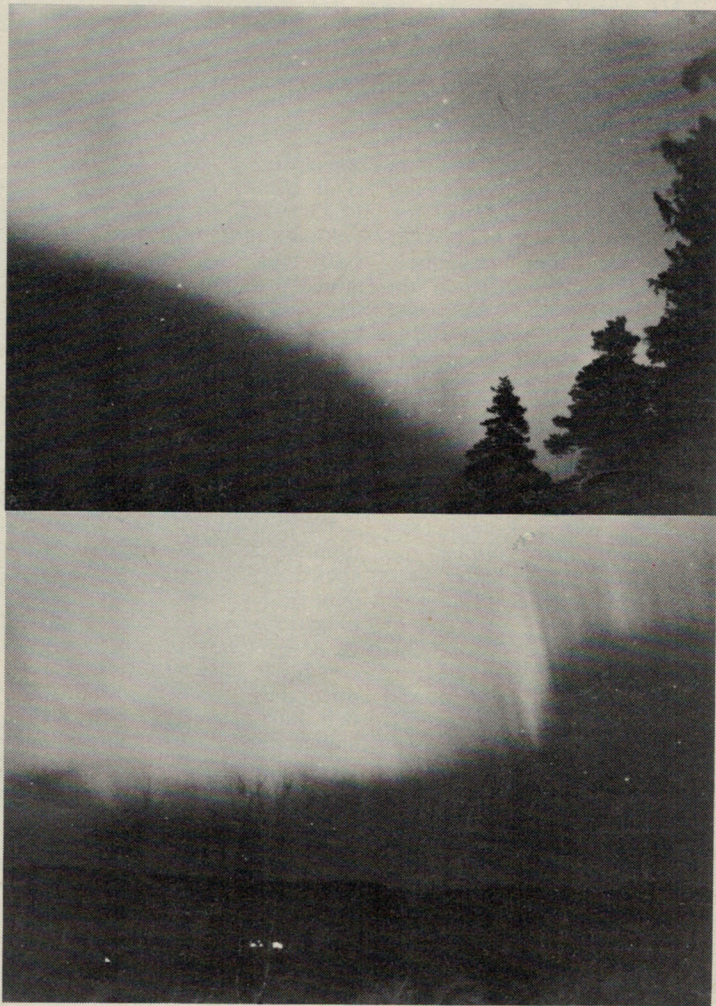
Undre bilden: Norrsken, fotograferat i Grängesberg i slutet av november, 1978. Samma norrsken som på bild 1 men under en senare utvecklingsfas.