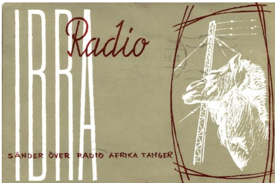
Einigung Marokkos vor. Die internationale Abendsendung war am 22. Dezember 1959 Empfangsbestätigung von IBRA Radio via Tanger (1956)

Zone Tanger und der spanische Teil Marokkos wurden dem Land einverleibt. Was Tanger betrifft, so wurde am 29. Mai 1959 ein königliches Dekret – ein Dahir – veröffentlicht. Es besagte, dass alle Rundfunksender ab dem 1. Januar 1960 verstaatlicht werden würden. Dies bedeutete, dass alle privaten Sender entweder schließen mussten oder ihre Sendeanlagen von der marokkanischen Regierung konfisziert würden.